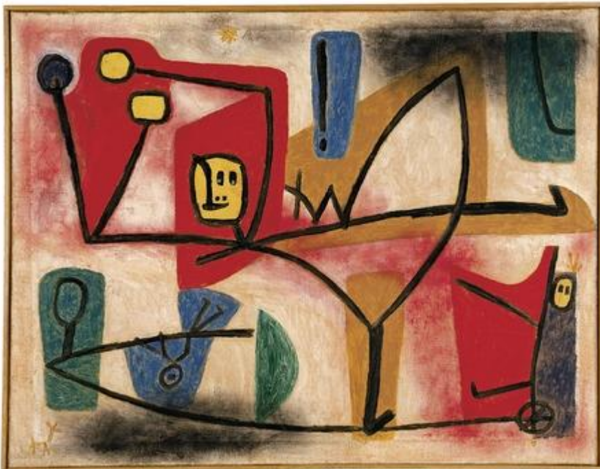
Paul Klee, UeberMut, 1939

1933 durfte er nicht mehr Lehrer sein. Mächtige Politiker in Deutschland mochten seine Kunst nicht. Und die Kunst von vielen anderen Leuten. Die Kunst war den Politikern zu modern. Sie haben dazu gesagt: Ent-artete Kunst. Ent-artet bedeutet: nicht normal.