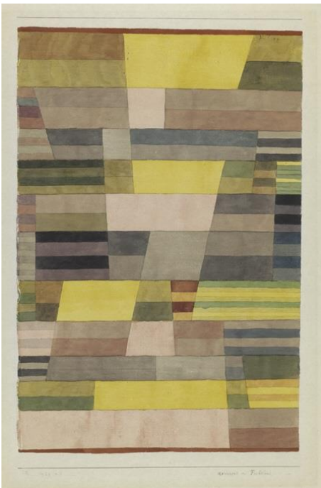
Paul Klee, Monument im Fruchland, 1929

Fruchland ist ein anderes Wort für Feld oder Acker.